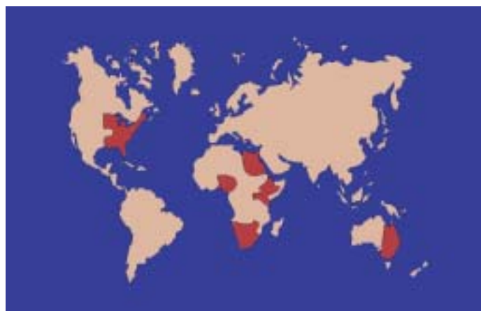
Figur 1. Verdensudbredelsen 2003 af den lille stadebille ( Aethina tumida )

Den lille stadebille ( Aethina tumida , Murray), se figur 3, er oprindeligt hjemmehørende i Afrika syd for Sahara, og den blev fundet første gang i 1867 i Vestafrika. Dens biologi i Sydafrika blev beskrevet i 1940'erne. Den kaldes "lille" stade-