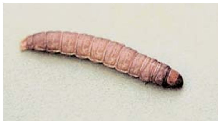
Figur 4. Voksmøllarve ( Galleria melonella )

lader de stadet for at forpuppe sig i den omkringliggende jord i ca. 2-8 uger afhængig af jordens temperatur og fugtighed, se figur 8. Jordtemperaturen skal ligge over 10°C, for at billens livscyklus kan gennemføres.