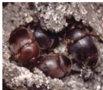
Figur 2. Nyudviklede biller; som endnu ikke har fået de voksnes mørke farve samt voksne biller på bærelisten

Den lille stadebille hører til familien Nitidulidae (glimmerbøsser). De voksne biller varierer i farve fra