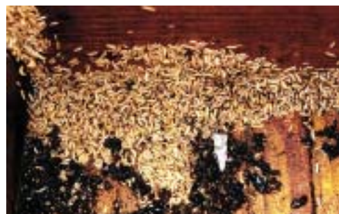
Figur 9. Når bifamilien er tæt på at bryde sammen samler billelarver og voksne biller sig på bundet af stadet

Men de europæiske honningbier mangler disse forsvarsmekanismer, og derfor udgør billen en langt større trussel mod dem. Svage bifamilier af europæiske underarter, som også findes i USA og Australien, kan bukke under i løbet af kun 2 uger, idet billelarverne lever af biernes yngel, pollen og honning og således gør stor skade på bifamilien. I svage bifamilier kan billerne hurtigt få overtaget. Man har beregnet, at der fra en enkelt biyngeltavle kan produceres 6000 billelarver, se figur 9.