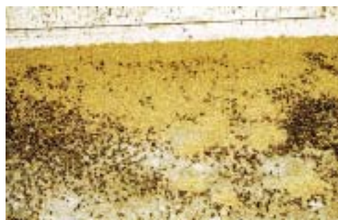
Figur 10. Store mængder larver på tavlelageret