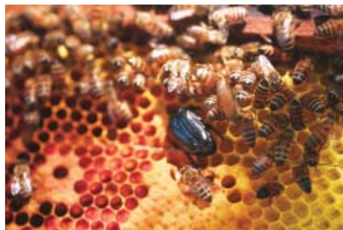
Figur 11. Stor stadebille (Hopllostoma fuliginous)