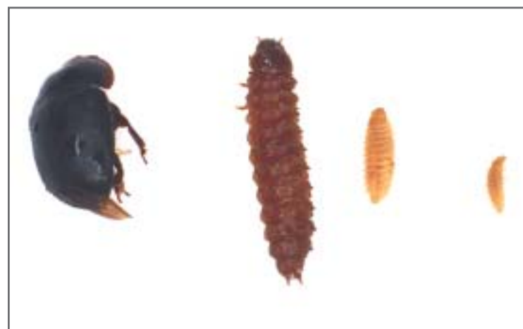
Figur 3. Forskellige larvestadier og voksen lille stadebille

De færdigudviklede larver samler sig på bistadets bund og i de nederste hjørner af tavlerne, se figur 7. Efter 10-16 dage for-